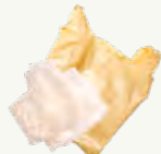
Bolsas y cualquier material plástico