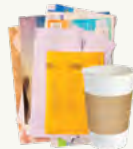
Papel y tazas de papel