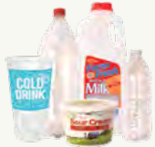
Botellas, vasos y recipientes de plástico