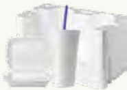
Vasos y recipientes de espuma o pajitas