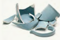
Platos y ollas de cerámica rotos